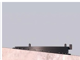
שלב ב' כוון את הבסיס עד לפילוס