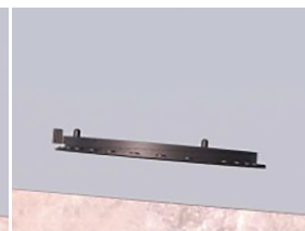
שלב א' מקם את הבסיס המתכוונן על הרצפה המשופעת