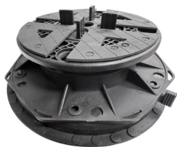
רגלית מורכבת על מפצה שיפועים